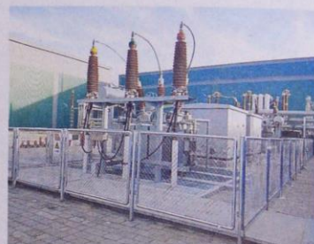
顺利投运目标而努力奋斗。(刘旭平)